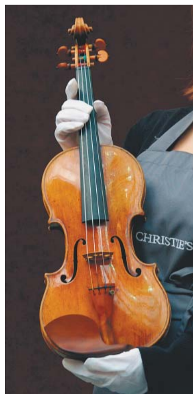
Eine Stradivari

Wer ein wertvolles Musikinstrument erwirbt, sollte sich bewusst sein, dass es nicht wie eine Aktie ohne weiteres handelbar ist. Erst muss sich ein Käufer finden, ehe das Stück veräußert werden kann.