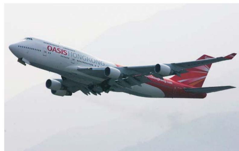
Zum Shoppen nach Hongkong?

Ein Trend zu Billigflügen auf der Fernstrecke zeichnet sich aber nach Ansicht von Experten trotz der neuen Angebote noch nicht ab. „Die Low-Cost-Airlines testen neue Geschäftsfelder, doch viele werden sich bei ihren Experimenten eine blutige Nase holen“, sagt